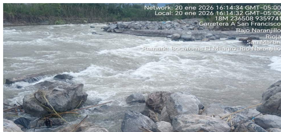
FIGURA N° 02: TRAMO CRÍTICO EN EL RÍO NARANJILLO, EN LA BOCATOMA EL MILAGRO