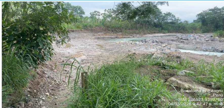
FIGURA N°01: TRAMO CRÍTICO EN LA BOCATOMA EL MILAGRO