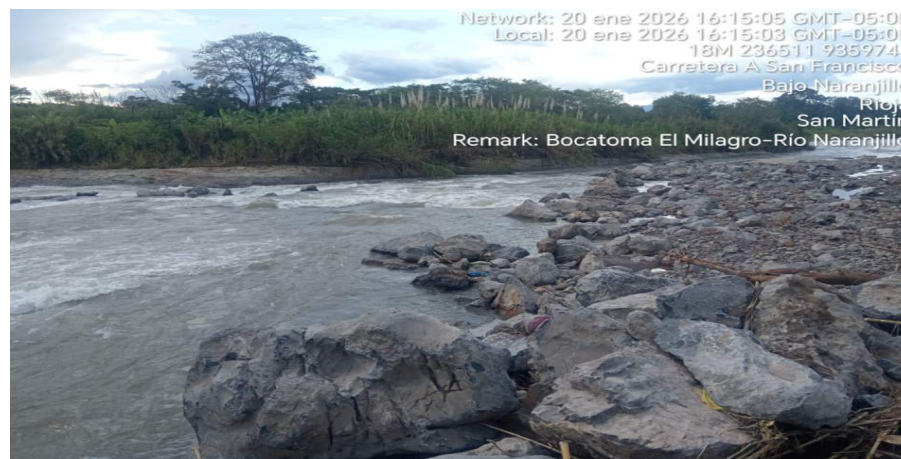
FIGURA N° 03: TRAMO CRÍTICO EN EL RÍO NARANJILLO, BARRAJE AFECTADO